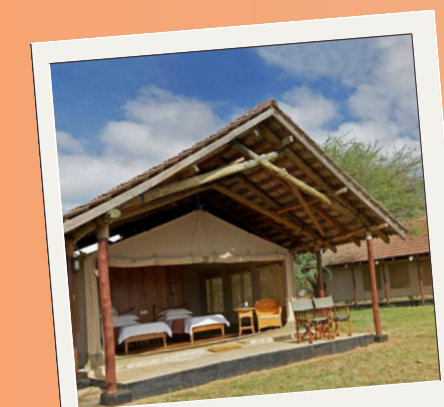
ASHNIL ARUBA TENT