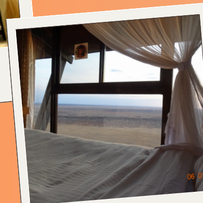
VOI SAFARI LODGE