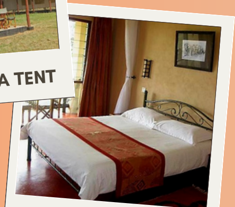
ASHNIL ARUBA LODGE